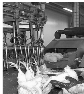
Figur 7. Upphängning.

När fåglarna kommer ur tunneln ramlar de ned från bandet till en så kallad karusell, som består av en roterande platta (se figur 6). Här står personal och plockar upp djuren manuellt och hänger upp dem i benen på byglar (se figur 7).