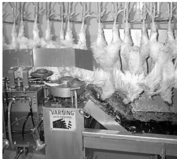
Figur 8. Avblodning.

Jugularvenen och carotidärtaren på ena sidan av halsen skärs av automatiskt av en roterande kniv (se figur 8). En person står här och undersöker att alla är tillräckligt avblodade. Om vakna fåglar hittas vid denna station tas de med genom tunneln ett varv till.