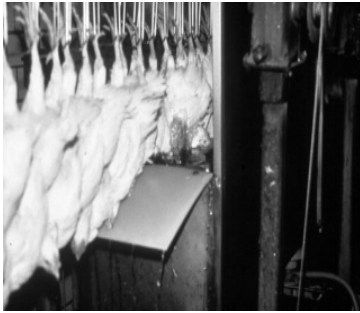
Figur 1. Vattenbad.

Vid el-bedövning tas fåglar upp manuellt eller automatiskt från transportlådorna och hängs upp i benen. De transporteras sedan automatiskt till ett strömförande vattenbad där de bedövas när huvudet går ned i vattnet (figur 1). Bedövning uppnås genom att ett epileptiskt anfall induceras och hjärnfunktionerna i cerebrala cortex förstörs. Detta medför att djuren förlorar medvetande och smärtkänsla (Buhr, 2003).