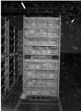
Figur 2. Container.

Djuren ankommer slakteriet i containrar som är indelade i åtta lådor och rymmer totalt ca 350 fåglar (se figur 2). Miljön hålls så mörk som möjligt för att förhindra stress bland kycklingarna. Lådorna kan dras ut från containern för besiktning av djur. Dessa har även en sådan design att man kan se fåglarna genom väggarna på lådorna.