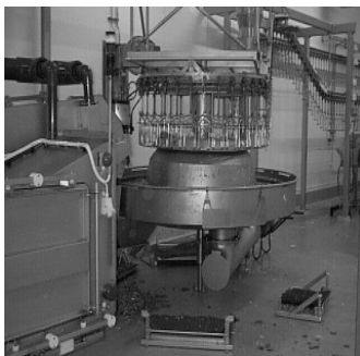
Figur 6. Karusell.