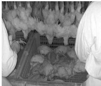
Figur 10. Upphängning

Lådorna med fåglar ankommer upphängningsstationen automatiskt på transportbandet från gastunneln (figur 9). Här arbetar fyra/fem personer med att manuellt hänga upp djuren i benen på byglar (figur 10). Djur som anses vara oanvändbara för köttproduktion, som t.ex. för liten storlek eller självdöd, plockas bort här och läggs i en behållare. Ingen rutin är utarbetad för att undersöka medvetandegrad hos djuren vid denna station.