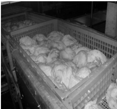
Figur 9. Bedövning i lådor