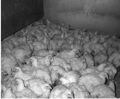
Figur 3. I samlingsfälla.

Kycklingarna tippas ur containern med en containertippare ned i en samlingsfälla vartifrån ett transportband startar (se figur 3). Här tippas fyra lådor i taget.