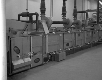
Figur 5. Gastunnel.

Djuren står på ett transportband som leder dem genom tunneln (se figur 5). Den första delen av bedövningsprocessen kallas induktionsfas, där djuren exponeras för en gasblandning bestående av c:a 38 % CO 2 , 34 % O 2 och 28 % N 2 under minst 60 sekunder. Det finns sex fönster i tunneln, 25 x 15 cm i storlek, där man kan se djuren passera förbi på bandet. Två av dessa, 36 sek respektive 55 sek efter tunnelns början, ligger under induktionsfasen.